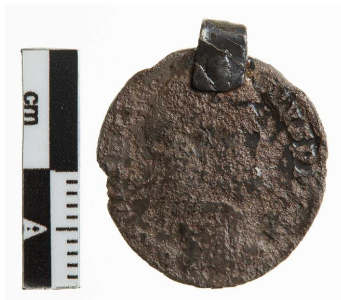
Romersk sølvmønt, fundet i Torstorp Vesterby, Torslunde sogn.

Detektorarkæologien har mere end fordoblet antallet af fund, og mængderne vokser stadig. De mange nye og ofte anderledes fund har haft en skelsættende betydning for vores nye og anderledes billede af møntbrugen i Danmark. I anden del vil der blive fokuseret specielt på fundene af romerske mønter i Danmark. Hvilken særlig betydning har detektorerne haft for disse fund? Hvad lavede de romerske mønter overhovedet heroppe i norden, så langt fra Romerriget? Hvem bragte dem? Hvem brugte dem? Og til hvad?