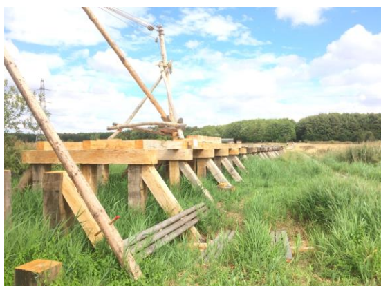
Vikingebroen over store Vejle Å