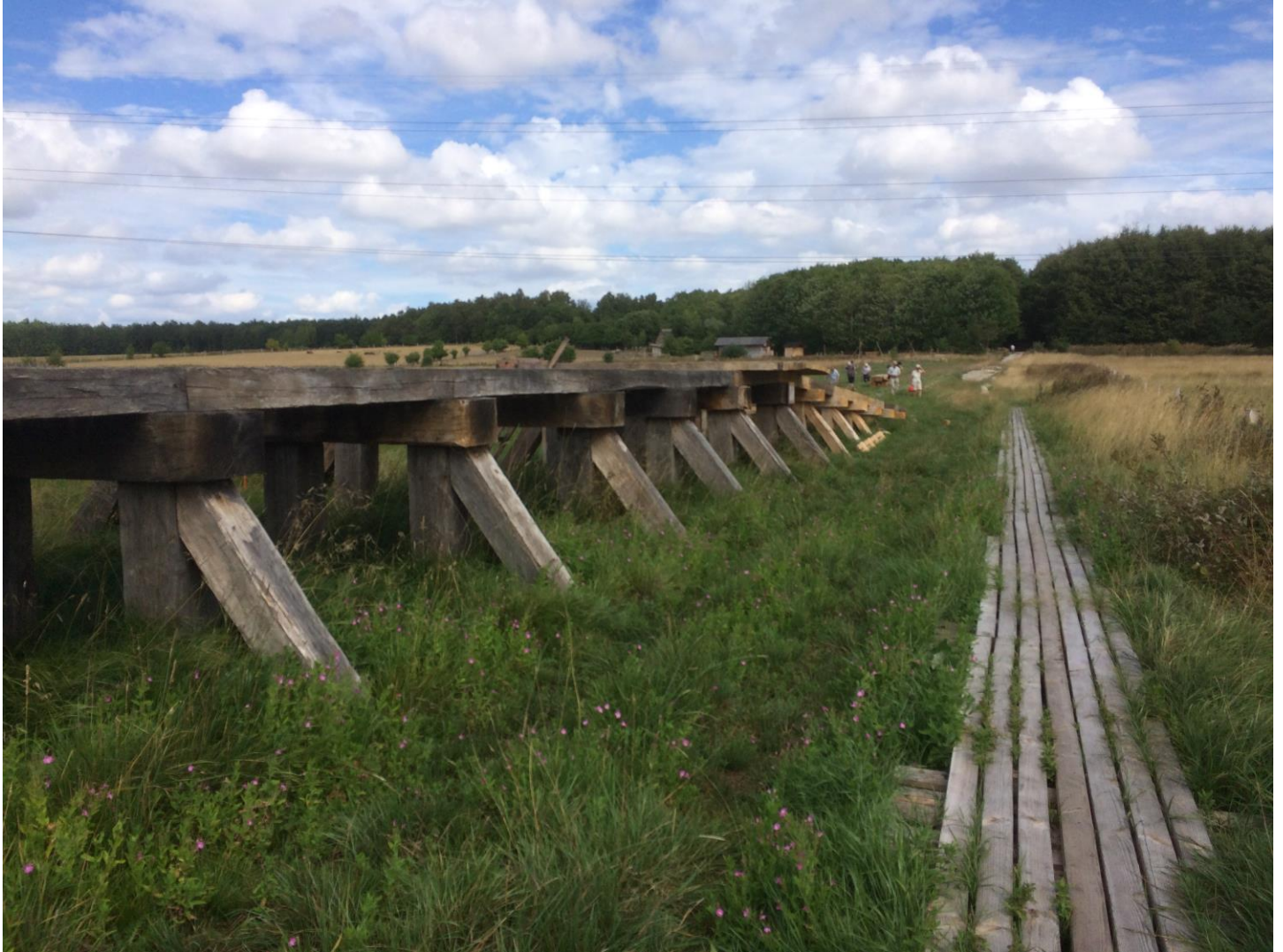
Tværpilen på udflugt til Vikingebroen der er ved at blive opført tværs over Store Vejleådalen

TVÆRPILEN – VESTEJENS AMATØRRARKÆOLOGISKE FORENING