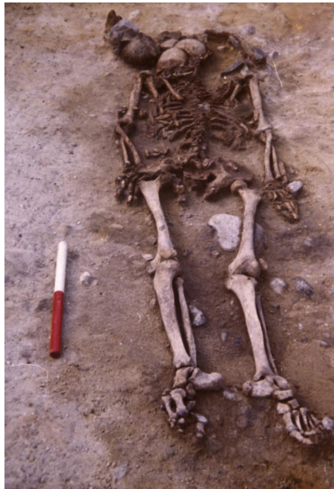
Udgravningsfoto af Dragsholm-manden, som sandsynligvis er en af de tidligste bønder i Sydsandinavien.

etablere praksisfællesskaber. Engagementet i praksisfællesskaberne ændrede den materielle kultur og et nyt agerbrugssamfund opstod i Sydsandinavien.