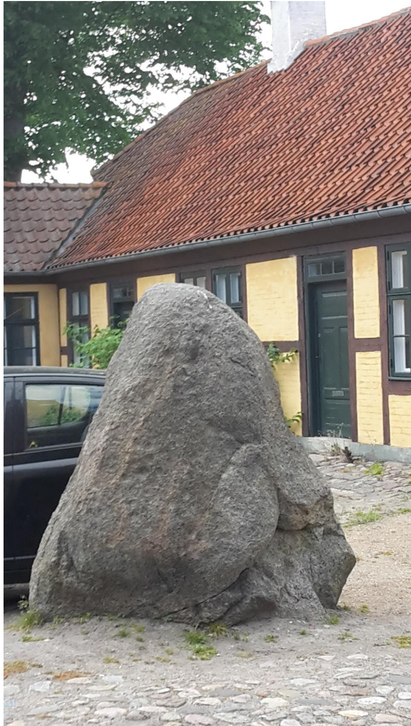
Bautasten med mange skåltegn, placeret overfor hovedindgangen til Roskilde Domkirke

TVÆRPILEN – VESTEENNS AMATØRRARKÆOLOGISKE FORENING