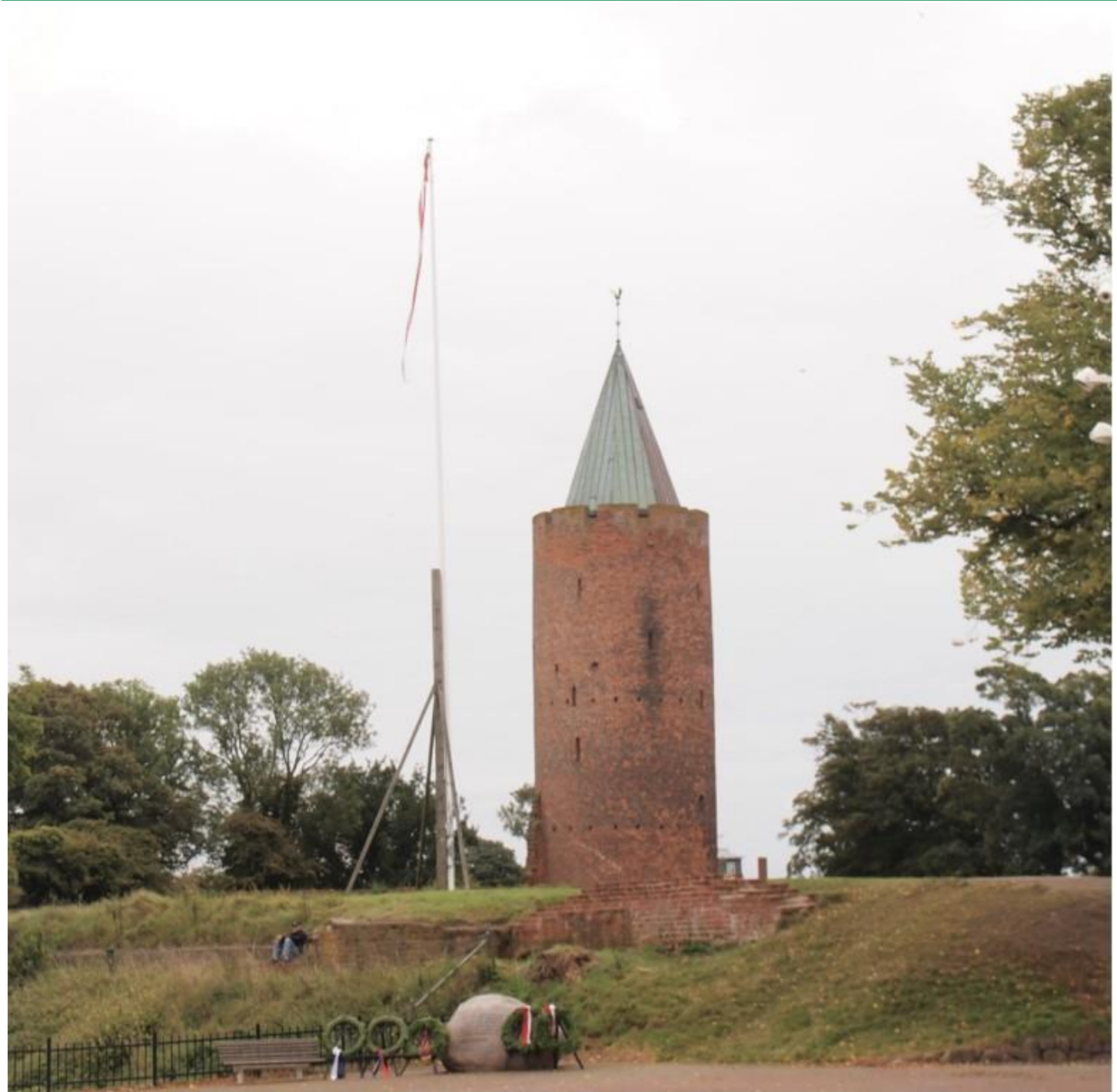
Gåsetårnet på tværpilens tur til Danmarks borgcenter