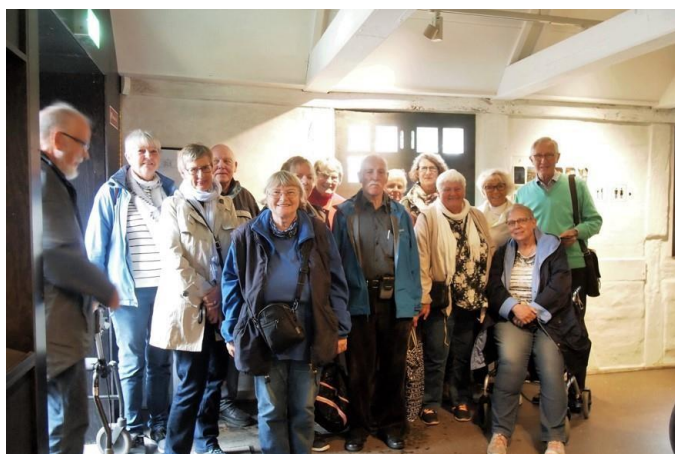
Deltagerne i turen til Vordingborg

Tværpilen havde i juni måned en fin tur til Danmarks Borgcenter i Vordingborg, som pt. har lånt en stor del af udstillingen i Hedeby, da Hedebymuseet er under renovation. Desværre var vejret ikke med os, men det var en meget spændende udstilling og vi fik en rigtig god rundvisning med en meget kompetent rundviser.