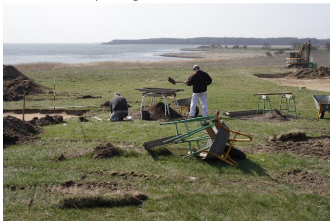
Udgravningen af Vester Egesborg

I mange år har arkæologiske spor efter vikingetiden været særsyn på Sydsjælland og Møn. Byggeri og anlægsarbejder har været færre end i hovedstadsområdet, så bebyggelserne er ikke dukket op ad den vej. Heller ikke metaldetektorerne har været i anvendelse i samme omfang som i andre dele af landet. Ikke mindst sidstnævnte har ændret sig i løbet af de seneste 6-8 år. Fra ganske få detektorfund om året, indleveres nu mellem 1000 og 2000 oldsager på årsbasis til Museum Sydøstdanmark, og en god del af dem er fra vikingetiden. Det sydligste Sjælland toner nu frem, og på Møn er fundmængden nærmest eksploderet. Men det er ikke enkeltfund det hele. Fra midten af 1990'erne og frem er der udgravet to anløbspladser, der begge præges af produktionsspor. Næs har været en hørforberedningsplads, mens Vester Egesborg især har fremstillet jern og tekstiler.