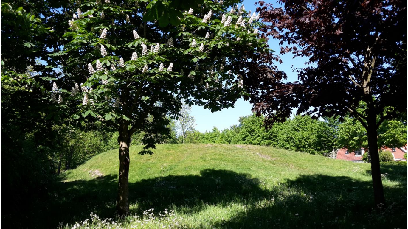
Bronzealderhøjen Blushøj i Dragør

TVÆRPILEN – VESTEJENS AMATØRARKÆOLOGISKE FORENING